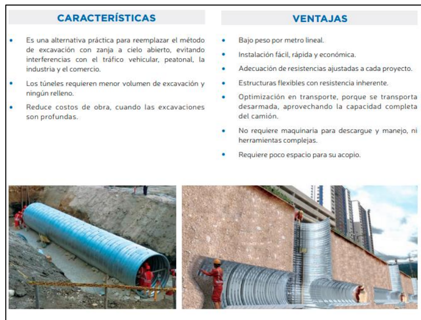
Figura 1. Metodología Tunnel Liner.

Es necesario realizar el cruce sub-vial con la metodología de perforación tunnel liner, entendiendo que brinda seguridad para los operativos que realizan las labores, disminuyendo la afectación en los cierres viales. El Oferente debe emplear esta metodología para realizar las actividades. En caso de ofertar una alternativa distinta, debe contemplar todos los requerimientos contemplados en estos términos de referencia.